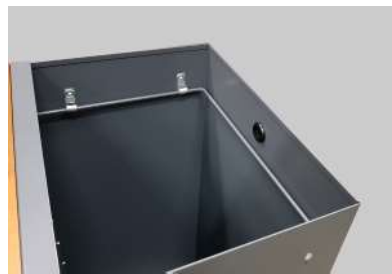
Cinturón sujeta bolsas interior